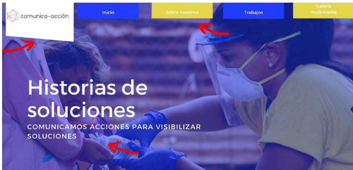
Ilustración 5 Homepage y menú principal Comunica-acción