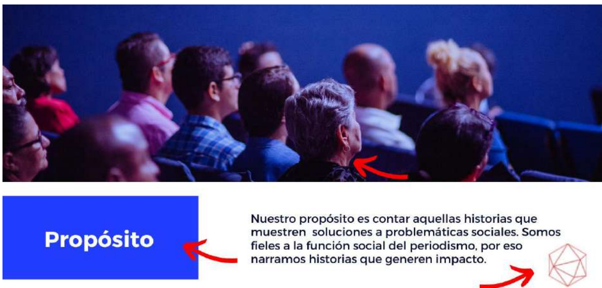
Ilustración 6 Páginas internas Comunica-acción

Dentro de esta sección de una de las páginas internas de la plataforma se incluyen tanto recursos multimedia como elementos de branding del medio digital. El objetivo principal que se buscó lograr con el diseño fue generar una estructura óptima capaz de transmitir coherencia estética y con las condiciones necesarias para albergar material multimedia.