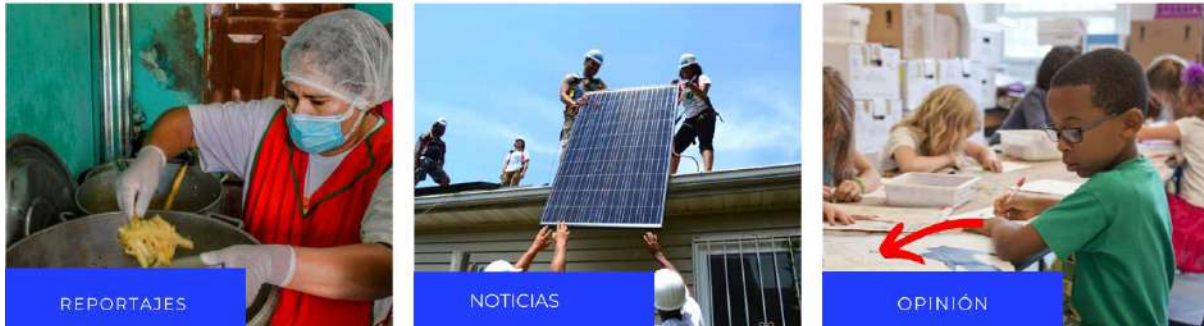
Ilustración 7 Páginas informativas Comunica-acción

Descubre con nosotros historias de periodismo de soluciones en Venezuela