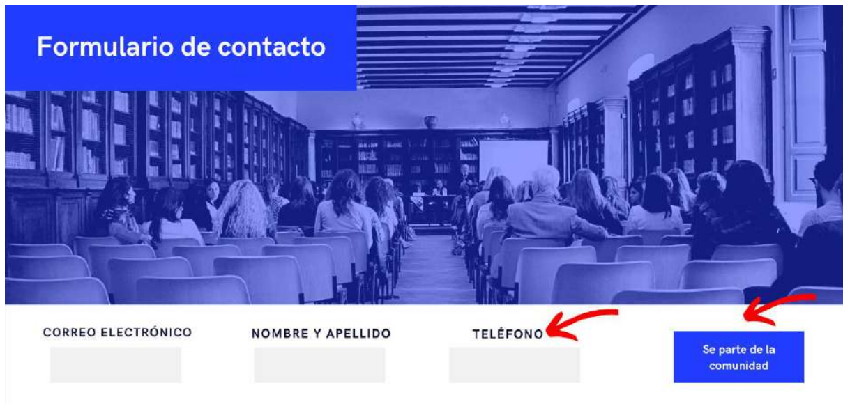
Ilustración 9 Formulario de contacto Comunica-acción

Por último, dentro del diseño de esta sección, se estructuró el mecanismo de interacción entre el público consumidor y el medio digital. En dicho apartado se pretende generar un mecanismo de recolección de datos para aquellos usuarios que quieran contactar con el medio.