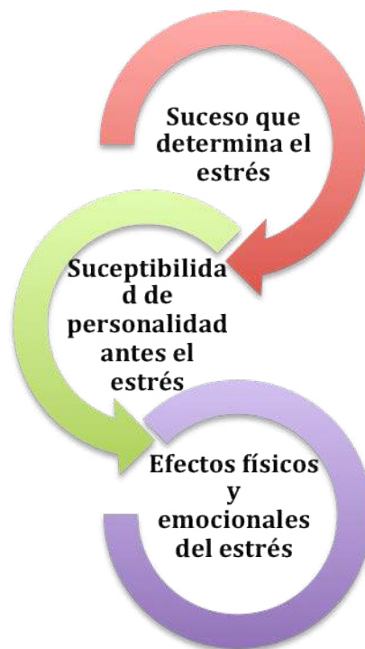
Gráfico 1. Aparición del estrés: Fuente: Grupokairos (2007). Diagnóstico del nivel actual de estrés y sus efectos en la salud. México

El estrés aparece como desencadenante frente a un evento estresor en relación a la importancia que la persona le da a este hecho, además de la capacidad que tiene para darle frente a ésta situación.