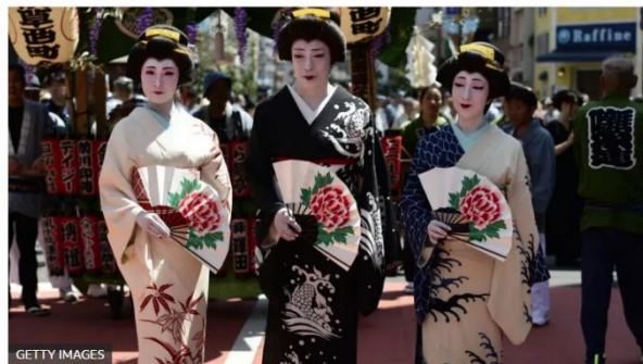
El kimono es una prenda tradicional que tiene siglos de tradición en Japón.